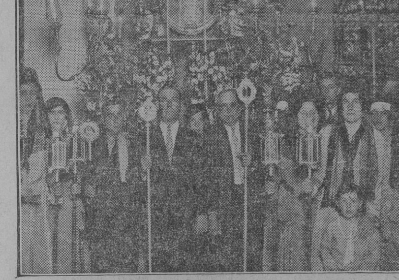
La imagen de la Virgen del Consuelo, que ayer salió procesionalmente en San Juan de Aznalfarache

El conde de Halcón ha agradecido mucho la adhesión recibida y espera que sobre tan importante asunto expresen su opinión las personas capacitadas para ello, a fin de que la solución definitiva sea el resultado del sentir general de la ciudad.