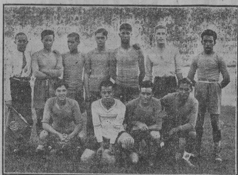
Equipo formado por los alumnos del Colegio María Cristina, de Toledo, que en el campo del Real Betis Balompié ha jugado un partido con el equipo de camateras.