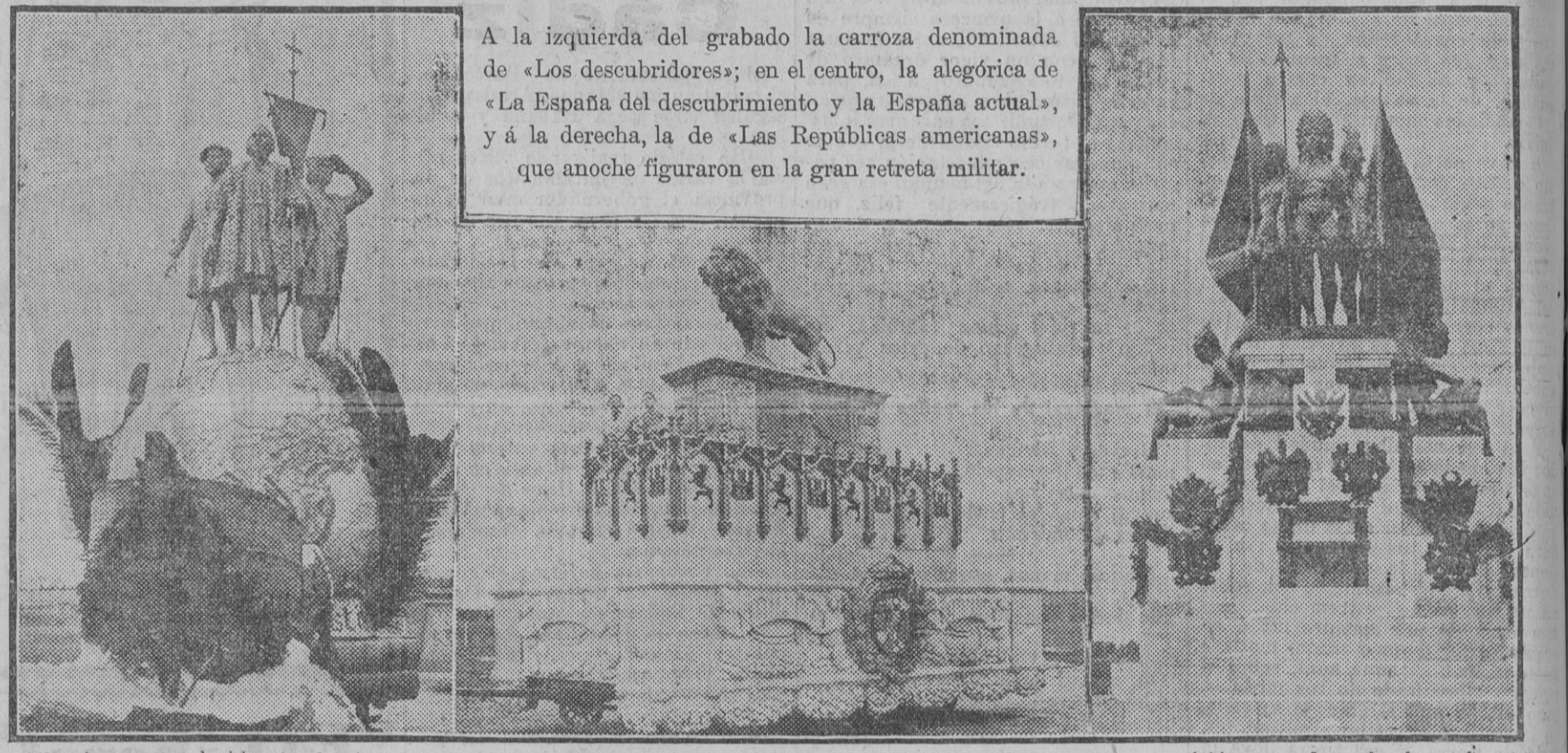
A la izquierda del grabado la carroza denominada de «Los descubridores»; en el centro, la alegórica de «La España del descubrimiento y la España actual», y á la derecha, la de «Las Repúblicas americanas», que anoche figuraron en la gran retreta militar.

Madrid 24.—En la Escuela de Arquitectura, donde se estaban celebrando exámenes de aparejadores, se produjo esta mañana un escándalo, que obligó al director del establecimiento á invitar á los alumnos á que abandonaran el local. El director de la Escuela ha acordado suspender los exámenes hasta el lunes 2 de Junio.