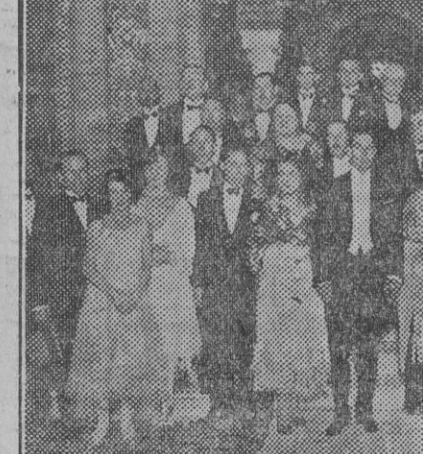
Concurrentes al banquete con que fueron obsequiados los miembros del Congreso de la Propiedad por la Cámara de Sevilla