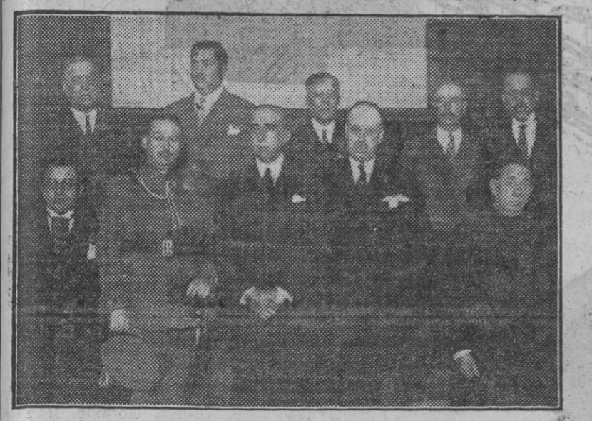
El ilustrado cronista de Valladolid, dió la primera de sus charlas castellanas