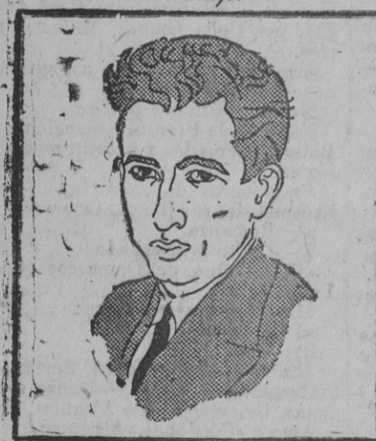
Niño del Museo.