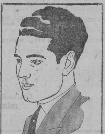
Niño de Marchena