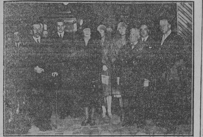
La familia real española, con el jefe del Gobierno, en la visita al Pabellón del Tabaco