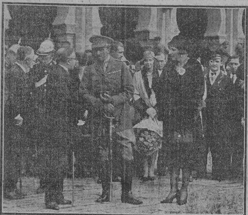
Don Alfonso conversando con el alcalde a su llegada a Sevilla.