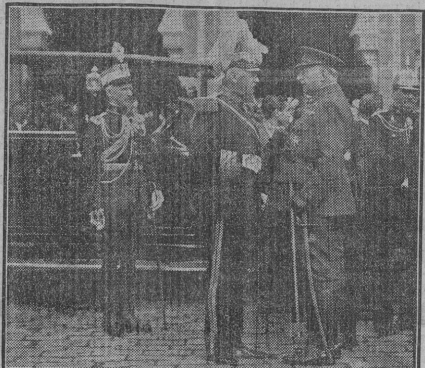
El infante don Carlos y el jefe del Gobierno en amistosa charla.

Desde mucho antes de la hora señalada para la llegada del tren especial que conducía a los Reyes los alrededores de la estación de la plaza de Armas fueron invadidos por el gentío que era difícilmente contenido por fuerzas de la Guardia civil y de Seguridad.