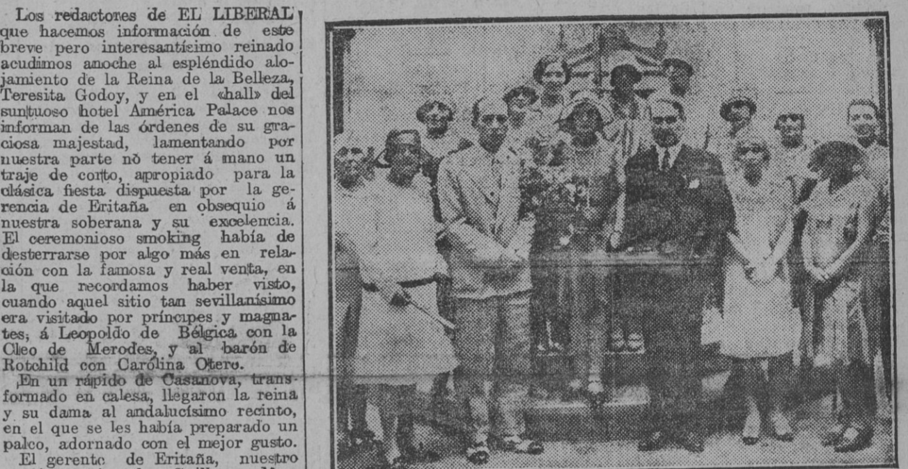
La Reina de la Belleza y su dama en la visita que hicieron ayer tarde al Pabellón Argentino.

La visita a la Catedral y al Palacio de las Dueñas.—La fiesta de anoche en la Venta de Eritaña.