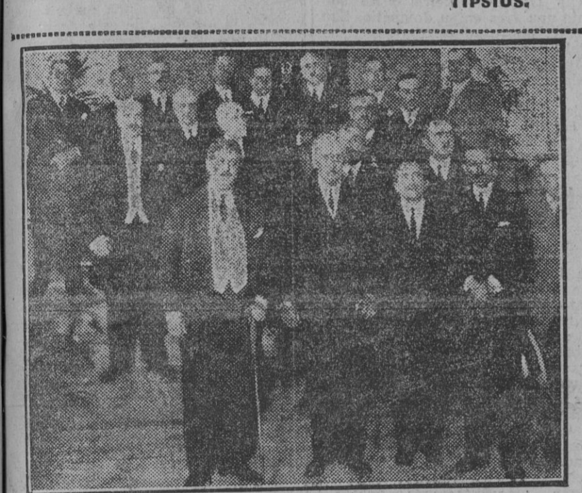
El infante Don Carlos, con el Ministro de la Economía Nacional, conde de los Andes, y Gobernador civil, en el reparto de premios en la Algodonera.

Acaban de celebrarse con gran esplendor en Toulouse las solemnes fiestas del séptimo centenario de la fundación de aquella Universidad. El mismo Presidente de la República, M. Doumergue, ha consagrado con su presencia la gloria intelectual de Toulouse, capital espiritual de la occidente, que tanta parte tuvo en la formación de la cultura francesa.