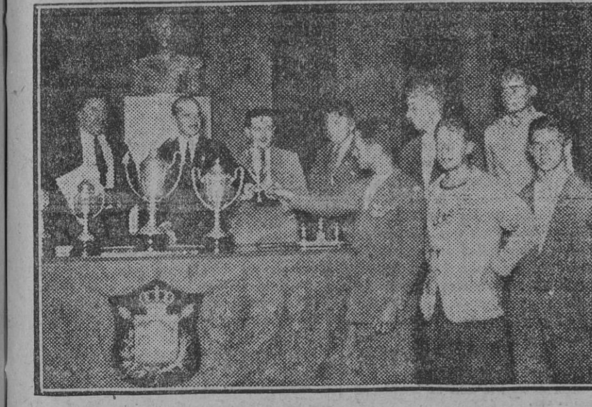
Entrega de premios a los ganadores de la carrera ciclista Sevilla-Huelva-Sevilla, patrocinada por el Comité de Deportes de la Exposición.

Este número de EL LIBERAL consta de 6 páginas