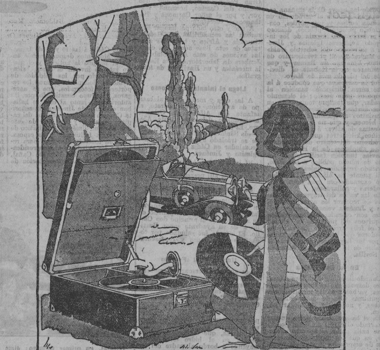
El ligero y cómodo portátil modelo 101 en cuero negro

Después de la merienda ponga usted los últimos éxitos. El sonido de este aparato portátil es siempre perfecto, brillante y puro.