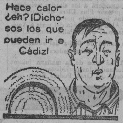
Hace calor ¿eh? ¡Dicho es los que pueden ir a Cádiz!

Un escultor aventajadísimo y modesto en demasía, el que modeló el bello busto de talla policromada de «Lagaraterana», que tantos elogios mereció de la crítica en el salón de la Económica, ha hecho ahora una escultura del Sagrado Corazón para la parroquia de San Esteban, en la que muestra los adelantos cada vez más visibles y ciertos el artista alumno de la sección escultórica de esta Escuela de Bellas Artes. De ejecución esmerada, y atento a los buenos principios del arte del modelado, la Sagrada imagen tiene una actitud de belleza plástica, acomodada al ideal religioso, mereciendo alabanza los deseos de la parroquia protegiendo al arte, tan alejado de esas imágenes de cartón piedra, todas iguales, preciosismo industrial; al que, como es natural, falta la inspiración personal del artista.