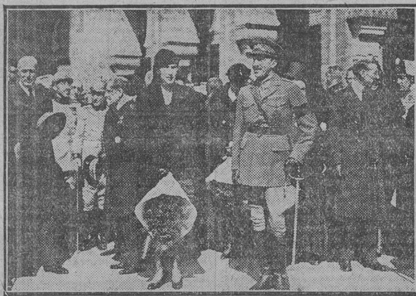
Los Reyes presenciando el desfile de las fuerzas que le rindieron honores, mientras el público los aclamaba entusiásticamente.

Desde mucho antes de la hora anunciada—diez de la mañana—para la llegada del tren especial en que hacían su viaje a Sevilla los Reyes Don Alfonso y Doña Victoria, las infantas Doña Beatriz y Doña Cristina y el jefe del Gobierno, general Primo de Rivera, comenzaron a acudir a los andenes de la estación de la plaza de Armas las autoridades, el elemento oficial y numerosísimas personalidades.