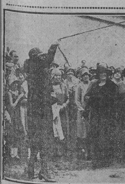
La infanta Doña María Luisa en el momento de bautizar la avioneta propiedad del Real Aero Club de Andalucía, en el festival celebrado esta mañana en la Base Aérea.

Acto seguido Don Alfonso revistó la compañía que le rindió honores, cuya banda no cesó de interpretar el himno real hasta que los Reyes salieron al vestíbulo de la estación. Al paso de los Reyes por el andén, la concurrencia que lo ocupa-