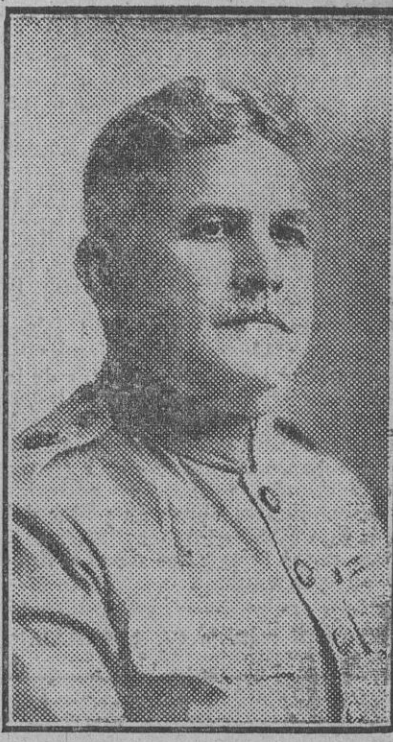
Nació en Vueltas, provincia de Santa Clara.