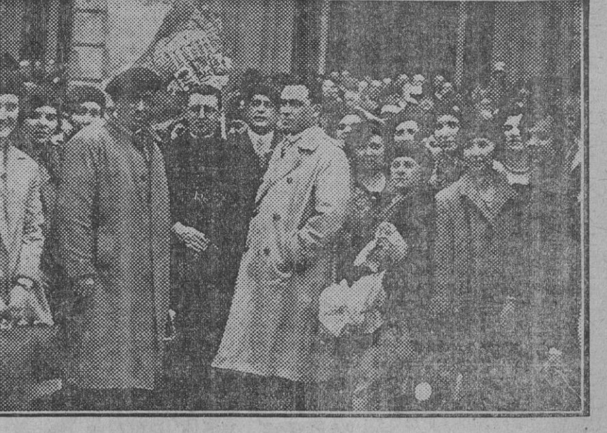
Los directores del Orfeón Vasco, con los elementos que integran la notabilísima masa coral, á su llegada á Sevilla en la mañana de hoy.

El número de nuestro teléfono es el 25.348