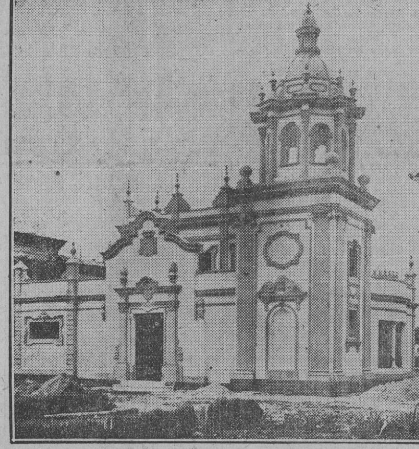
El hermoso pabellón de la provincia de Cádiz, construido en el sector Sur de la Exposición. (Foto. S. del Pando.) (Fdo. Gora.)

ESTE NUMERO HA SIDO VISADO POR LA CENSURA