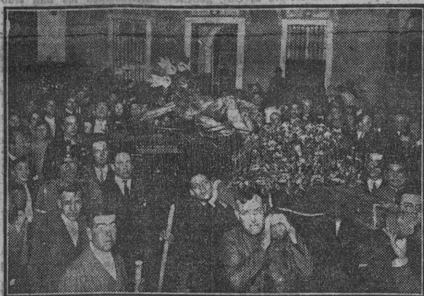
Traslado de la milagrosa imagen de San Isidoro desde la iglesia del Salvador a la de San Isidoro.