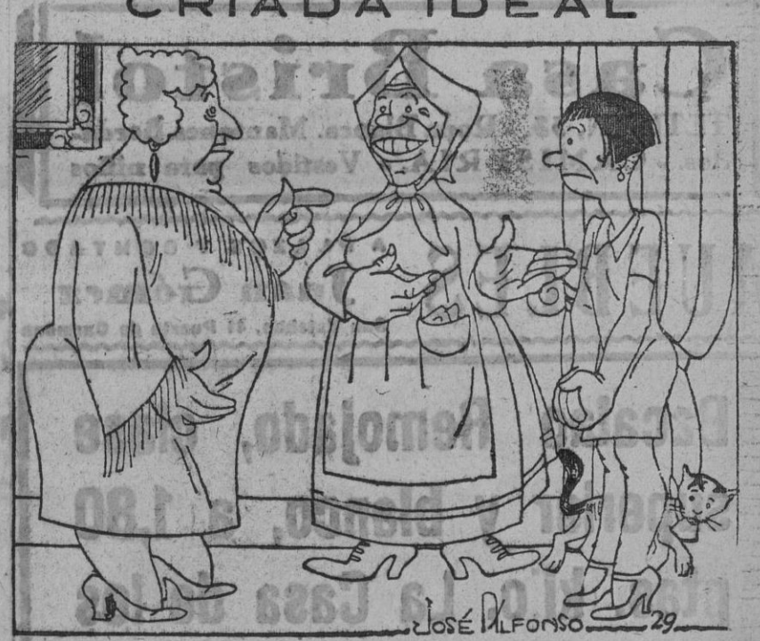
Lo que no puedo tolerar en las criadas es que sean responsables. Pues mi hijo no tiene ese defecto. Está usted segura de que no me contestará? Segurísima; es sordomuda de nacimiento.