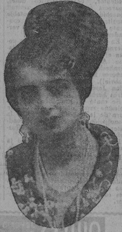
DE NUESTRO CONCURSO DE BELLEZA Número 91.—SEVILLA. Lema: ALEGRÍA.