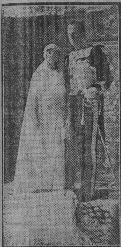
Los novios, nuevos condes de Zamoycki, después de celebrada la ceremonia de su enlace.

Esta literatura barata de la moral va a cuento de tan lamentable crisis de la sociedad presente, opresa entre el afán de la posesión, la posesión y el temor de ser desposeída. Generalmente, el volumen de lo que se juega no pertenece a los acaudales que, codiciosos, corren al riesgo y, sin embargo, la mayoría, absorbe en su inferioridad, ausente, les deja hacer, ignorante de que es suyo mucho de lo ganado y perdido. ¡Crisis peligrosa y estigmática, que conduce a un pueblo al idiotismo o a la apoplejía. Porque, materializada en la forma en que lo está la vida, ¿hay que proibir el dinero o que tirarlo a cordel por todos los bolsillos. O que desvalorizarlo como algo cruel, falaz y despreciable que enciende el infierno en la tierra. De otro modo, habrá hombres que, como el de la Bolsa de París, pierdan un millón de los otros», en tanto que de lo propio sólo merma una proporción mínima e irrisoria.