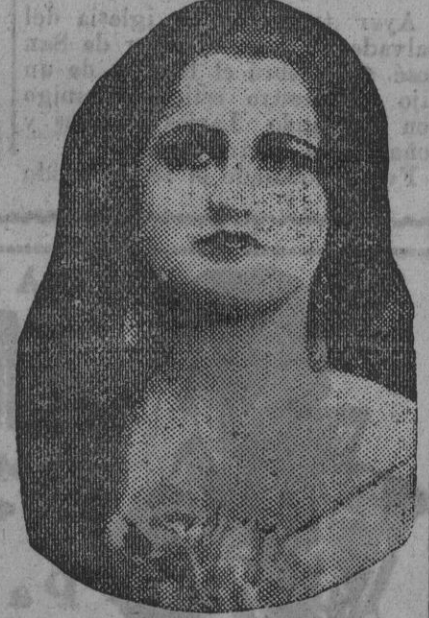
DE NUESTRO CONCURSO DE BELLEZA Número 93.—SEVILLA. Lema: PERLA

Se nos pregunta acerca de las obras complementarias del monumento del Cid, levantado en la antigua glorieta de San Diego, debiendo manifestar que ignoramos cuanto se refiere a este asunto. Como el público, que se interesa por estos detalles artísticos y su tuarios de la ciudad, estimamos que en la obra original de la señora norteamericana de Huntington faltan una porción de perfiles y retoques, que ya deberían haberse ultimados; por ejemplo: la colocación de las inscripciones que han de llevar los dos frentes del pedestal; la instalación de la verja que suponemos ha de proteger el monumento, y el asfaltado y arreglo del amplio refugio, en cuyo centro se levanta la bella estatua ecuestre del Cid Campeador. El terreno de este extenso refugio, dejando suficiente margen para la fácil holgura del transeúnte, es susceptible, a nuestro entender, de alguna artística decoración, complemento del conjunto de la obra. Sería lástima que llegada la fecha inaugural del Certamen americano el monumento y la zona en que se alza ofreciesen un aspecto desagradable de inconcluido.