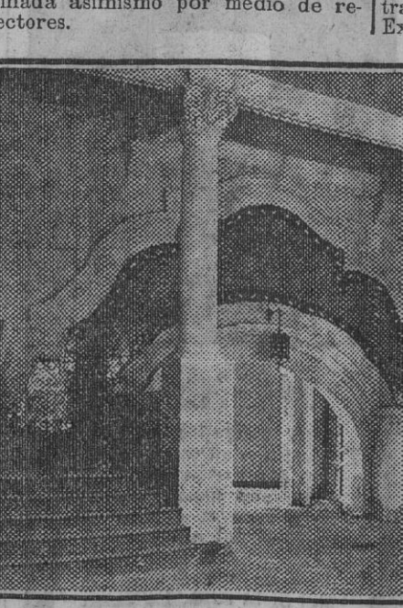
Arranque, en el «hall», de la doble escalera que conduce a la planta alta.

armonizado el ladrillo y la cerámica, iguales en su trazado a los que adornan la fachada principal del pabellón. La artística farola central del «hall» tiene, alternados en sus cuatro caras, los escudos brasileño y español. Lo mismo se ha hecho con las farolas restantes del mismo estilo y más reducido tamaño, construidas todas en Sevilla. En el peristilo se han instalado cuatro reflectores que proyectarán su luz sobre la entrada, a la que da acceso una amplia escalinata. La fachada del pabellón será iluminada asimismo por medio de reflectores.