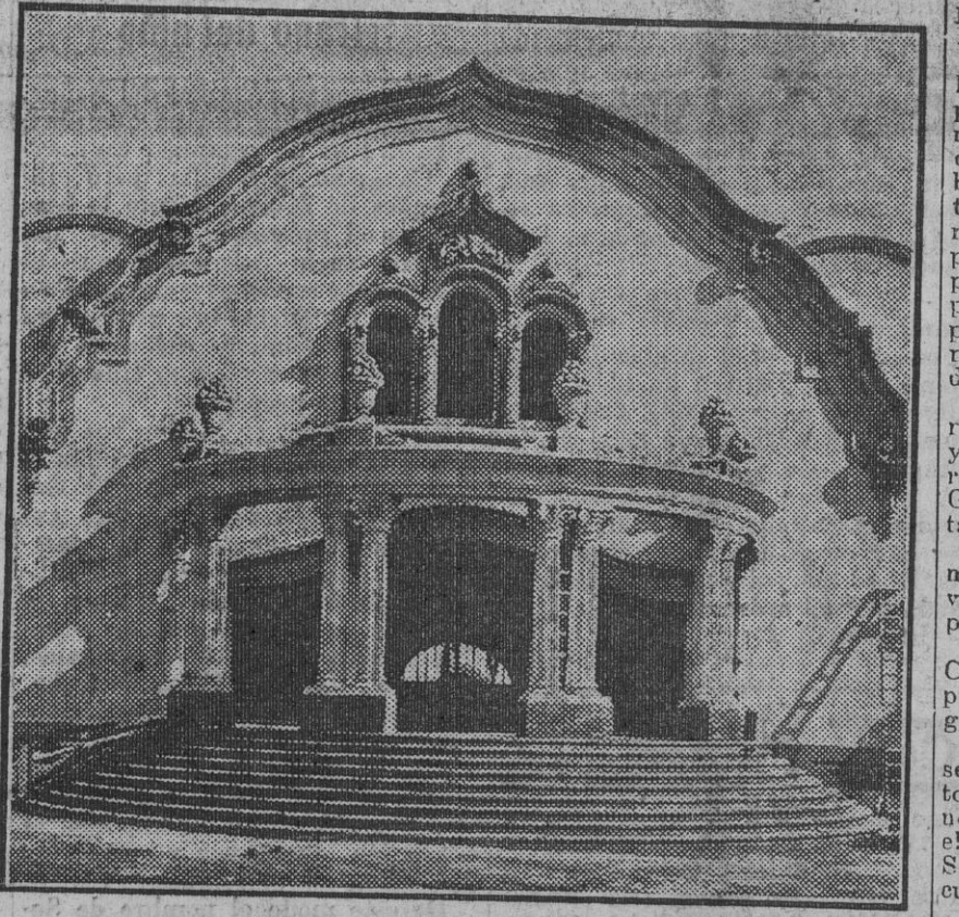
Entrada al pabellón del Brasil.