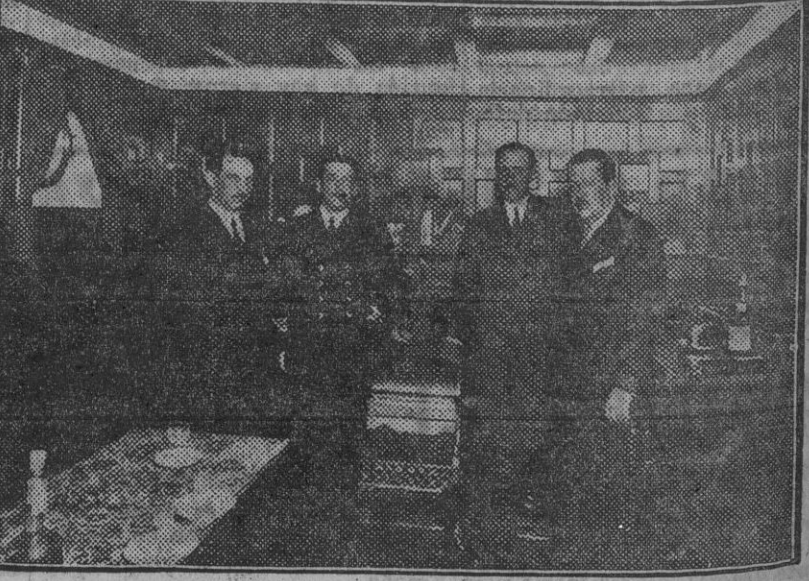
En la magnífica cámara del «Anbotto Mendi». El capitán quiere un sencillo recuerdo de nuestra visita.

La Compañía Sota y Aznar, estableciendo estos servicios, ha venido a solucionar un problema, ya que estos buques de motor, consumidores de un cuarenta por ciento menos que los de vapor, permiten hacer una considerable rebaja en los fletes.