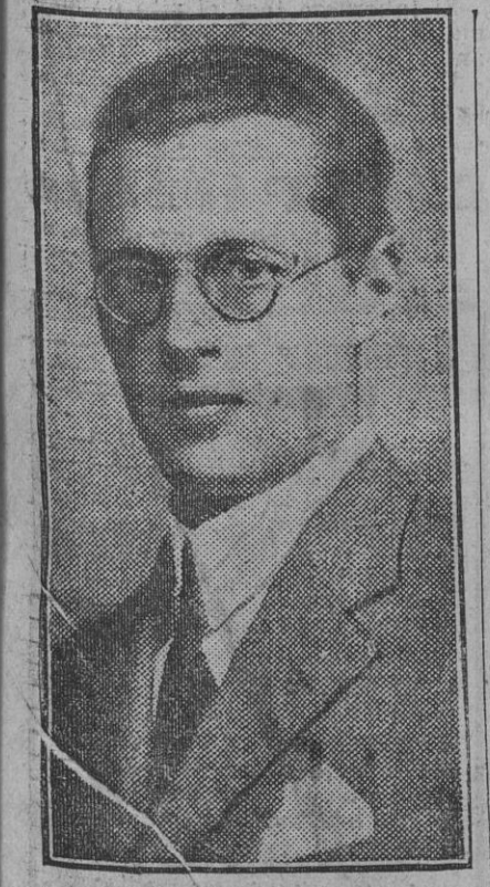
M. KASIMIR WIERZYNSKI Brillante poeta polonés y gran talento literario que ha alcanzado un premio por un volumen de poesías titulado «El laurel olímpico».

Madrid 7.—Esta mañana á medio día, el conde de Jordana, que ha sido nombrado, como se sabe, Alto Comisario de España en Marruecos, se estuvo despidiendo del personal de la Dirección de Marruecos y Colonias, que ha desempeñado durante bastante tiempo.