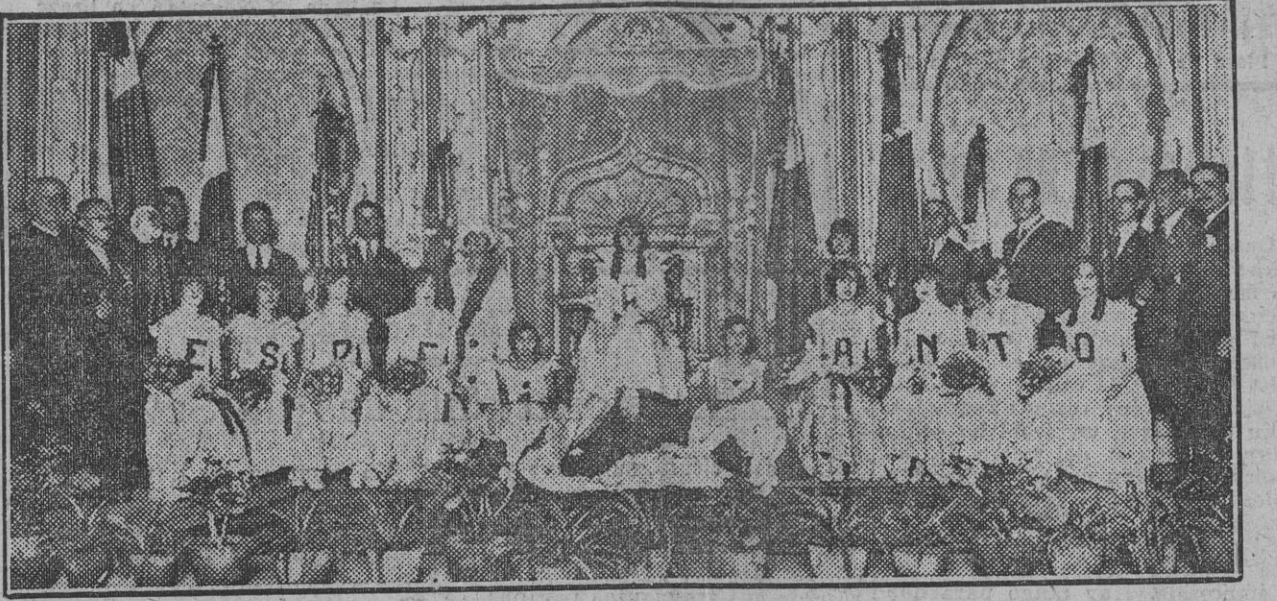
La Corte de Amor en la fiesta de esta mañana.

A las once de esta mañana dió comienzo en el teatro Llorens, que presentaba animadísimo aspecto, el primer concurso literario internacional esperantista, organizado por la Sociedad Esperantista Española con motivo del Congreso que se celebra actualmente.