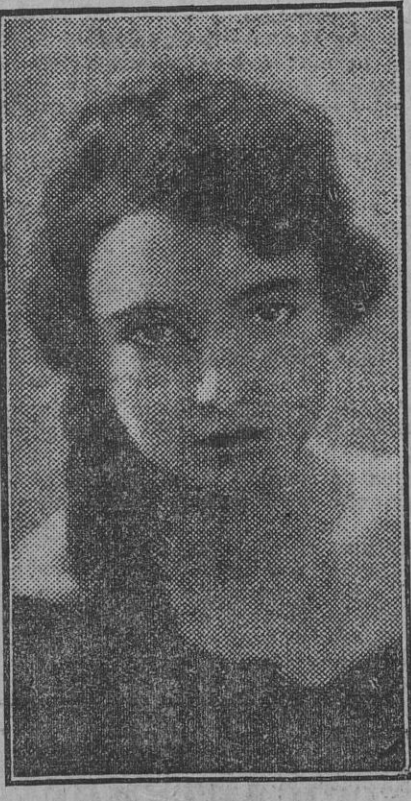
MLLE. HALINA KONOPACKA Joven polonesa que ha obtenido este año en la Olimpiada de Amsterdam el primer premio en los juegos del disco.