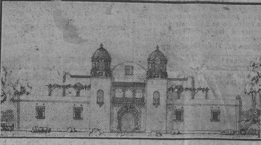
El pabellón colombiano, acualmente en construcción.

Los gastos de estas obras importarán de diez á doce millones de pesetas.