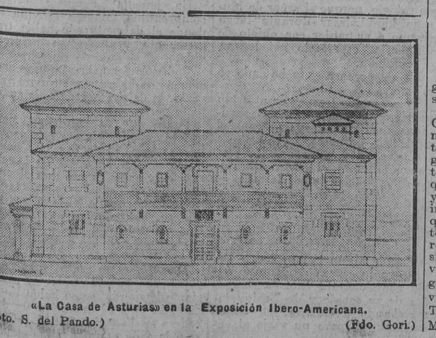
«La Casa de Asturias» en la Exposición Ibero-Americana.

Después de muchos paseos por toda la ciudad, he hablado de esto con un extraño tipo que á veces me ha acompañado en mis andanzas: un viejo profesor de origen indio, que lleva varios años en Rusia trabajando en una obra sobre el regionalismo. Este hombre me decía: Los comunistas se han equivocado en esto como en muchas otras cosas. Por petulancia, porque estaban convencidos de la fuerza revolucionaria que dentro llevaban, quisieron dar la batalla al sentido tradicional de la existencia en el foco mismo del tradicionalismo.