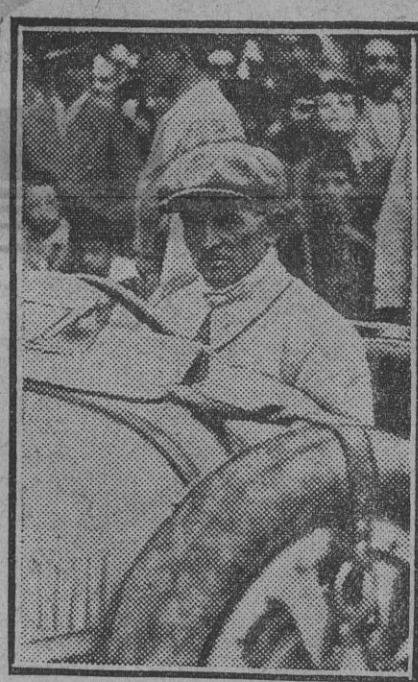
MONZA (Italia).—El gran corredor automovilista Matorasí, que al intentar pasar á otro corredor en la prueba del Gran Premio de Europa, se despidió, precipitándose sobre el público y ocasionando 22 muertos y 31 heridos.

Este número ha sido visado por la censura.