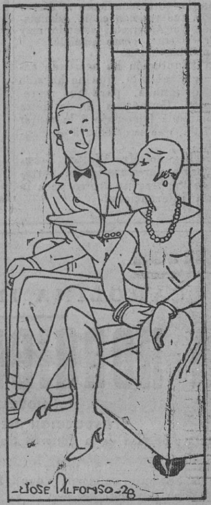
El—Hijita, no comprendo por qué vas tanto á confesar. Ella.—¡Tonto! Es que así tengo una ocasión más de hablar de ti.

Este número ha sido visado por la censura