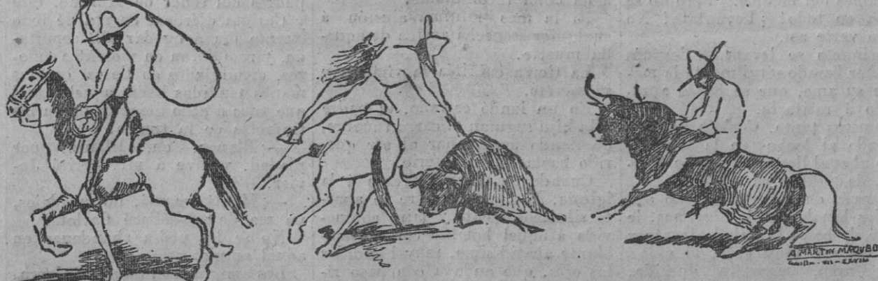
Tres momentos de la actuación de los charros mejicanos en la corrida nocturna del sábado. (Dibujos de Martín Maqueda.)

Este número ha sido visado por la censura