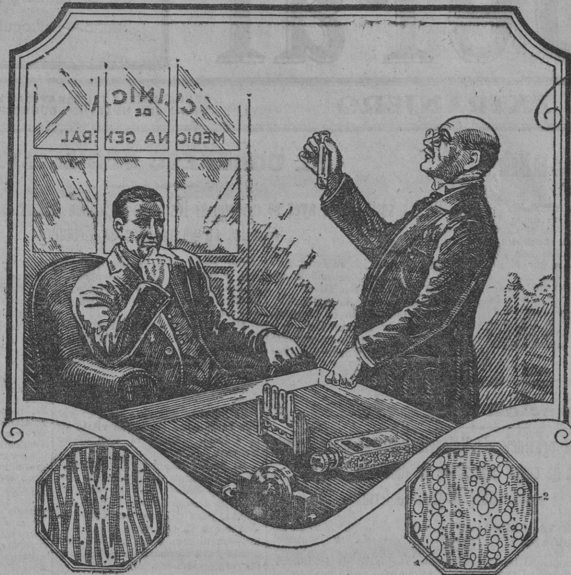
Corazón normal Fibras musculares con estricciones oexas.