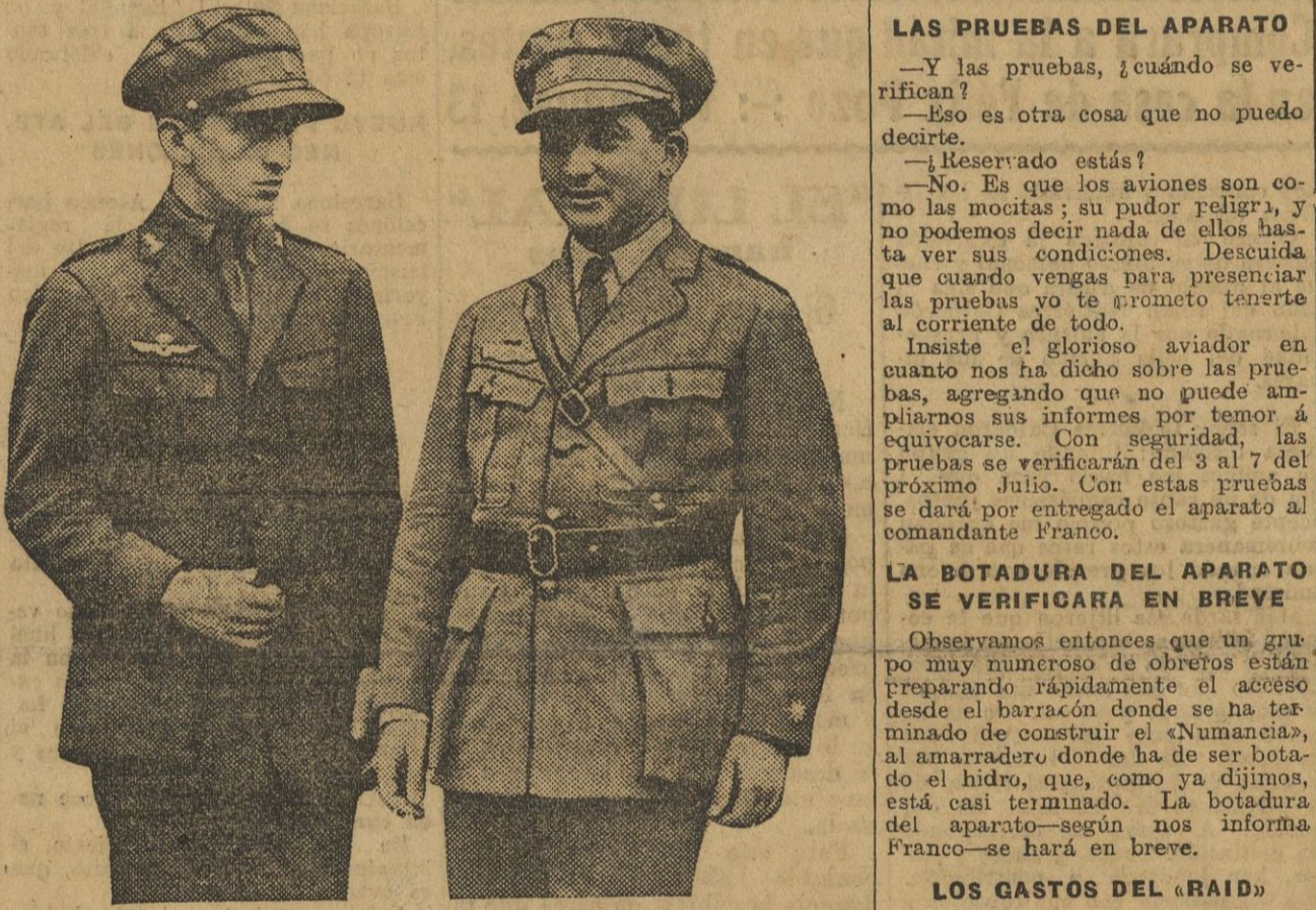
Franco y Rada, las dos figuras más populares del vuelo Palos-Buenos Aires, vuelven a ser la más patipatán en actualidad, atrayendo hacia ellos el interés mundial.

En breve tendrán lugar la botadura y las pruebas del «Numancia» (CRONICA TELEFONICA DE NUESTRO REDACTOR ENVIADO ESPECIAL, D. ANTONIO OLMEDO) HABLANDO CON LA ESPOSA DEL GLORIOSO PILOTO Un hidro alemán que realiza un viaje de estudio