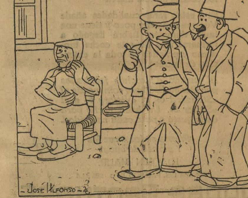
—¿Ves esa mujer tan sucia? Pues todo el día se lo pasa echándose polvo. —¿Es posible? —Sí; ¡polvos isotérmicos!

LA SUERTE NOS FAVORECE. FRANCO EN LA FACTORIA DE PUNTALES Nuevamente estamos en la Factoría de Puntales. Apenas han transcurrido treinta horas desde nuestra visita a los talleres, y las exigencias de la información nos obligan a volver a ellos.