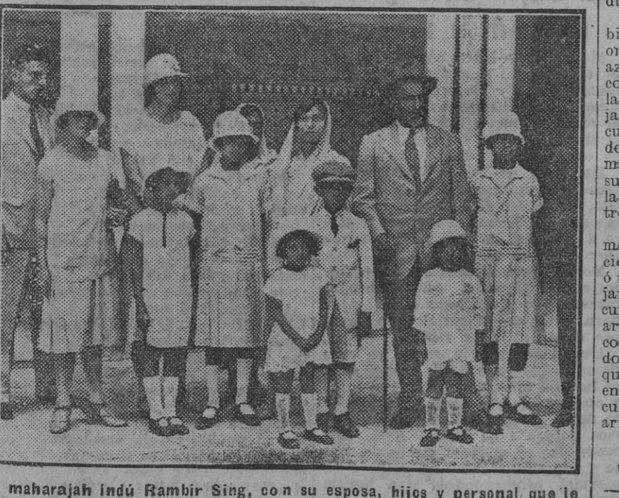
El maharajah Indu Rambir Sing, con su esposa, hijos y personal que le acompaña.

Este número de EL LIBERAL consta de 6 páginas.