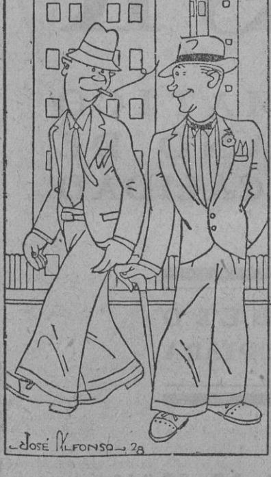
—Voy a dar una vuelta por la calle del Infierno. —Pues ten cuidado no te vayan a estafar. —Por qué lo dices? —Mómbrre, porque hay allí cada día vivón!

Los empleados de la Exposición Ibero-Americana—ellos y ellas—han instalado en la Feria una caseta verde, de la que se sale «morao». ¡Qué modo de obsequiar, caballeros! La caseta está muy bien instalada y ameniza los bailables una magnífica orquesta. Los ibero-americanos empezaron a bañar por la tarde, y a las tres de la noche todavía decían algunas niñas: —¡Pero ya nos vamos! ¡Tan temprano...! Y vuelta a empezar. Del ambigü de la caseta obsequian al visitante con vinos y emparantes selectos y tienen con los forasteros unas atenciones como para no irse. Anoche se hizo en la caseta de la Exposición una gran labor de aproximación ibero-americana—italiana—portuguesa—anglo—madrileña— catalana. Ya tarde, cuando empezó a entrar el ganado en la Feria, según en la caseta una reunión dándole escucha a un sombrero anecho, color plomo, que se había quedado dormido en la cabeza de su dueño. ¡Y quién dejaba en la Feria un sombrero solo a aquella hora...! Del mujerío taquimeca ibero-americano no decimos una palabra. El que quiera ver mujeres guapas que