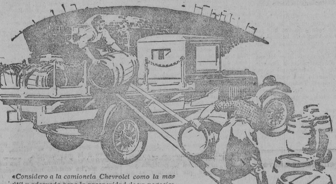
«Considero a la camioneta Chevrolet como la más útil y adecuada para la prosperidad de un negocio»

Y hasta el próximo domingo, que tendremos en campeonato Utrera Balompédicta-Coria F. C.—Asián Pérez.