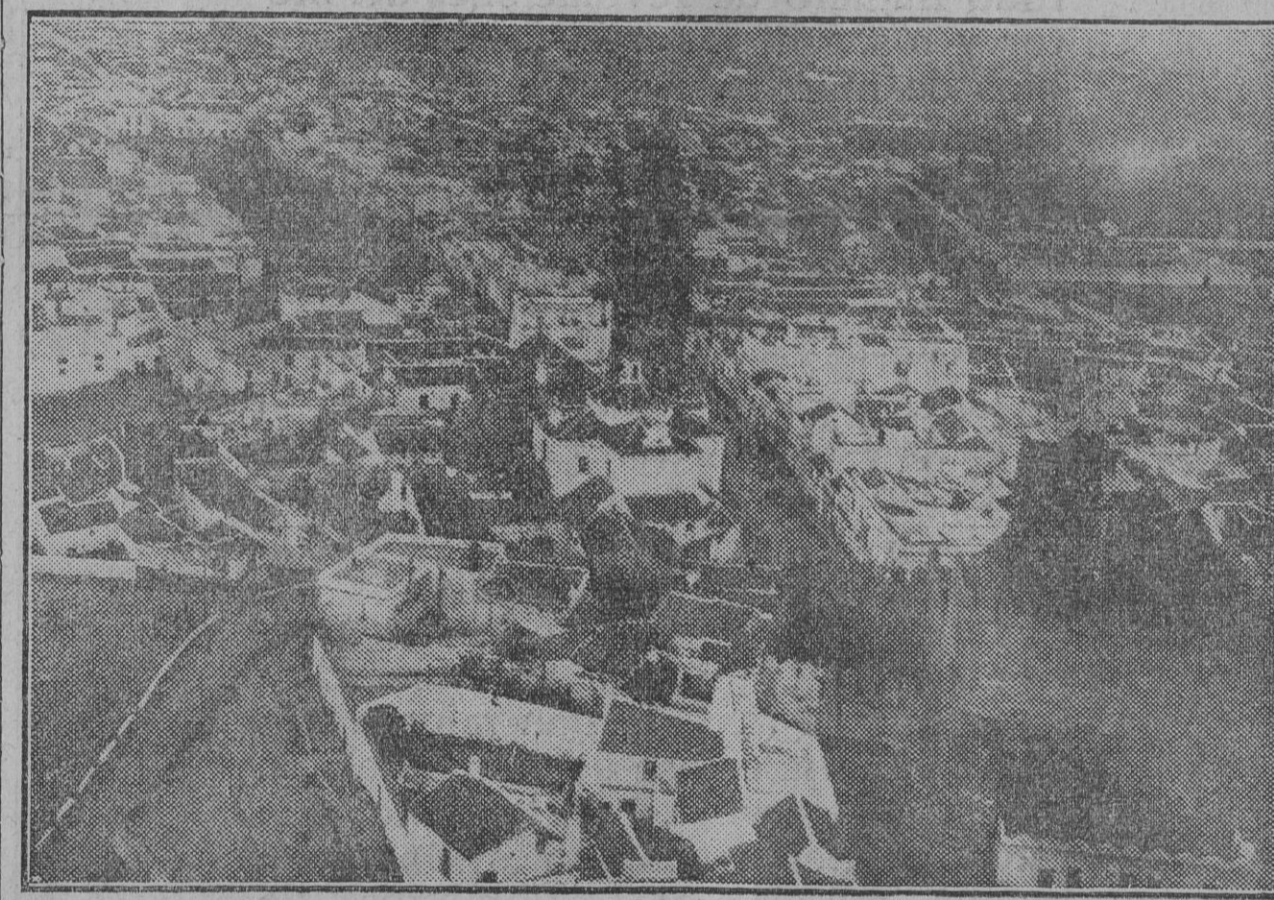
Una interesante vista de Carmona en la cual se destaca en primer término la iglesia de San Pedro con su Giralda. A la derecha, la Puerta de Sevilla y la Alcazaba.