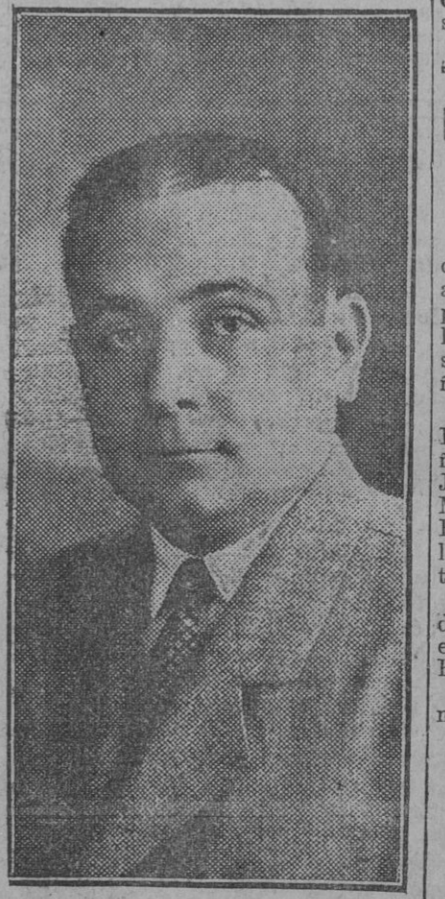
Capitán don J. Martínez Castells, comisionado técnico y sustituto del comisionado general del Gobierno de la República de Cuba en la Exposición Ibero-Americana de Sevilla.

Constantinopla 4.—La Asamblea Nacional ha concedido el levantamiento de la inmunidad parlamentaria contra el diputado Ali Riza Bey, complicado en el asunto de malversación de fondos de la Caja de la Asamblea.