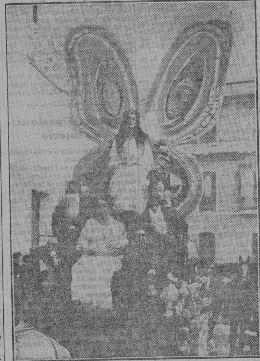
La carroza de la ilusión, que cerrará la cabalgata, ha llamado poderosamente la atención del elemento infantil