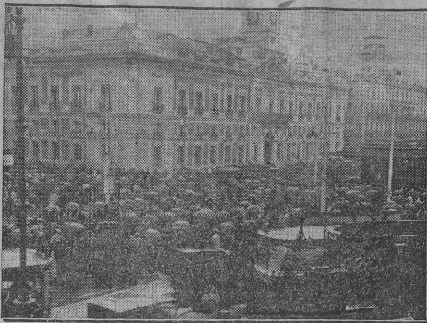
MADRID.—Aspecto de la Puerta de Sol llena de público estacionado ante las carteleras con los premios de la lotería.