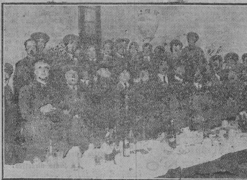
«Lunch» con que los jefes y oficiales del regimiento de Soria celebraron la sesión de clausura de la Hermandad del Botijo.