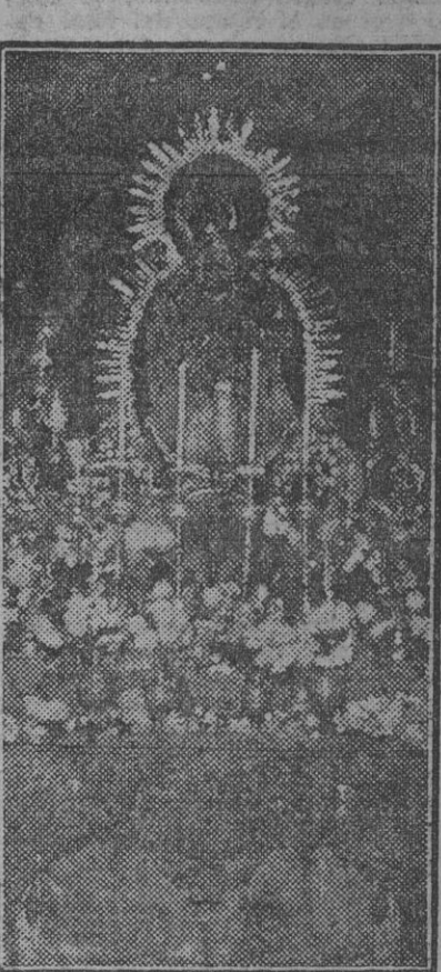
El nuevo epaso de la Virgen del Amparo