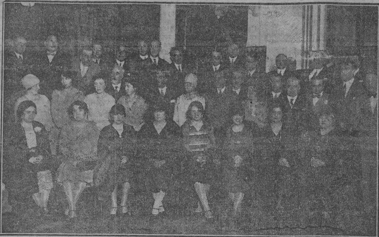
Miembros del Club Rotario de Sevilla, con las representaciones de los de varias provincias y distinguidas damas, después de la fiesta celebrada anoche en el Hotel de Madrid.