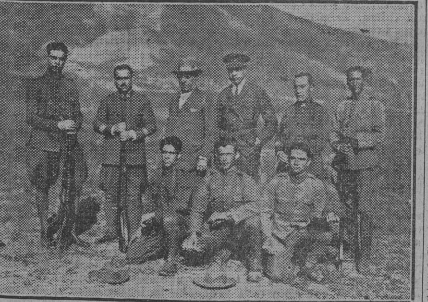
Equipo del regimiento de Soria que ayer ganó el premio en el Polígono de Tiro á los demás equipos de las fuerzas de la guarnición.