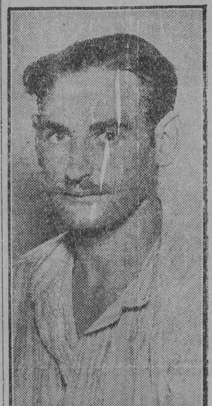
El "Legionario" en el Manicomio. Desde Pueblonuevo del Terrible es traído a Sevilla por un hermano suyo.

Desamóssele muchas felicidades en su nuevo estado.