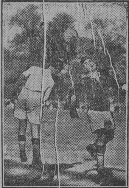
Uno de los pocos momentos de interés que tuvo el encuentro de ayer entre onubenses y sevillanos.