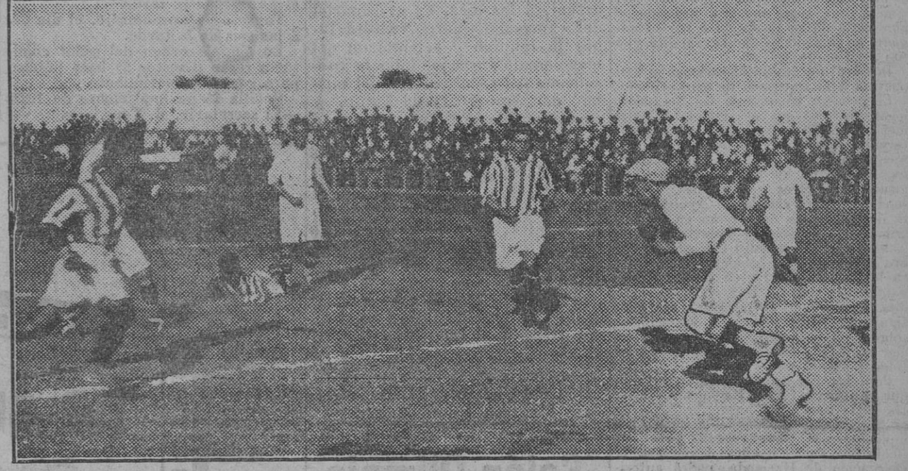
Una excelente parada del portero del F. C. Malagueño durante el partido celebrado ayer tarde en nuestra capital.

El partido de inauguración de la temporada actual, celebrado ayer en el terreno del Real Patronato entre el F. C. Malagueño y el Real Betis Balompie, no pasará a la historia.