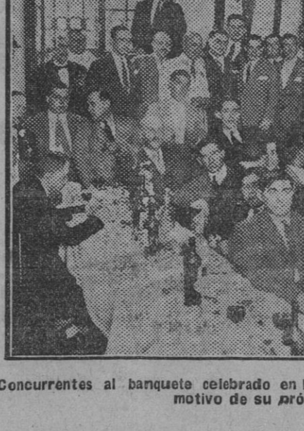
Concurrentes al banquete celebrado en honor del novillero Enrique Torres con motivo de su próxima alternativa.