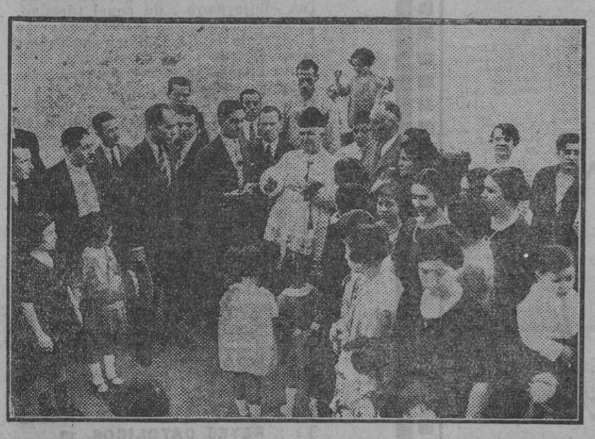
Acto de inaugurar y bendecir el grupo de casas construido en la Avenida de Ramón y Cajal por la Sociedad «La Española».

Como a las nueve de la mañana salió del escritorio y se sentó en una butaca de mimbre que había en el corredor. La familia permanecía en sus habitaciones. Cogió una pistola automática de pequeño calibre, y apoyándose el cañón en la sien derecha, disparó, cayendo pesadamente al suelo, arrastrando en su caída la butaca. El suicida estaba en mangas de camisa.