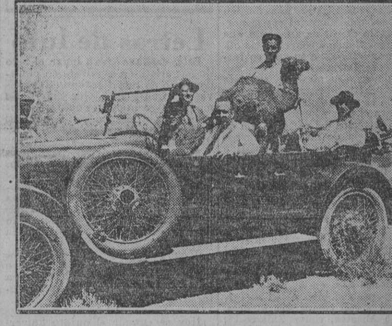
El dromedario más pequeño de los cazados, que viaja en automóvil como un «hombrécito».