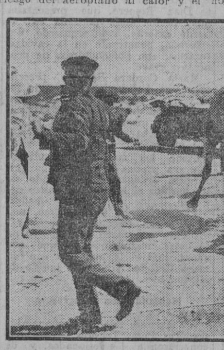
Momento de enlazar un camello viejo para derribarlo y colocarle la cabezada rústica con que ha de ser conducido al encierro.