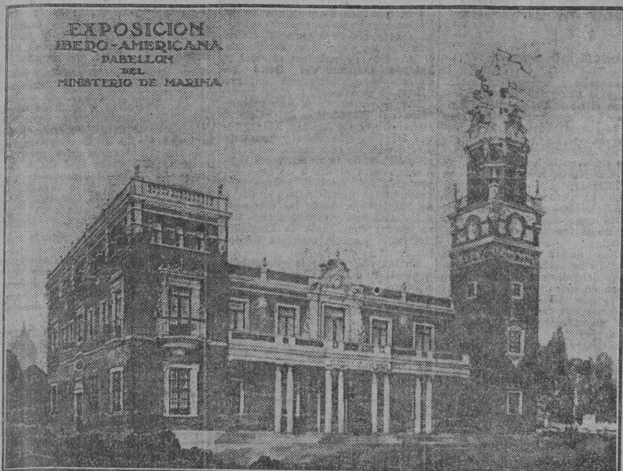
El Pabellón de la Marina de Guerra española en la Exposición Ibero-Americana, cuyo lugar de emplazamiento, características y demás detalles conocen ya nuestros lectores.