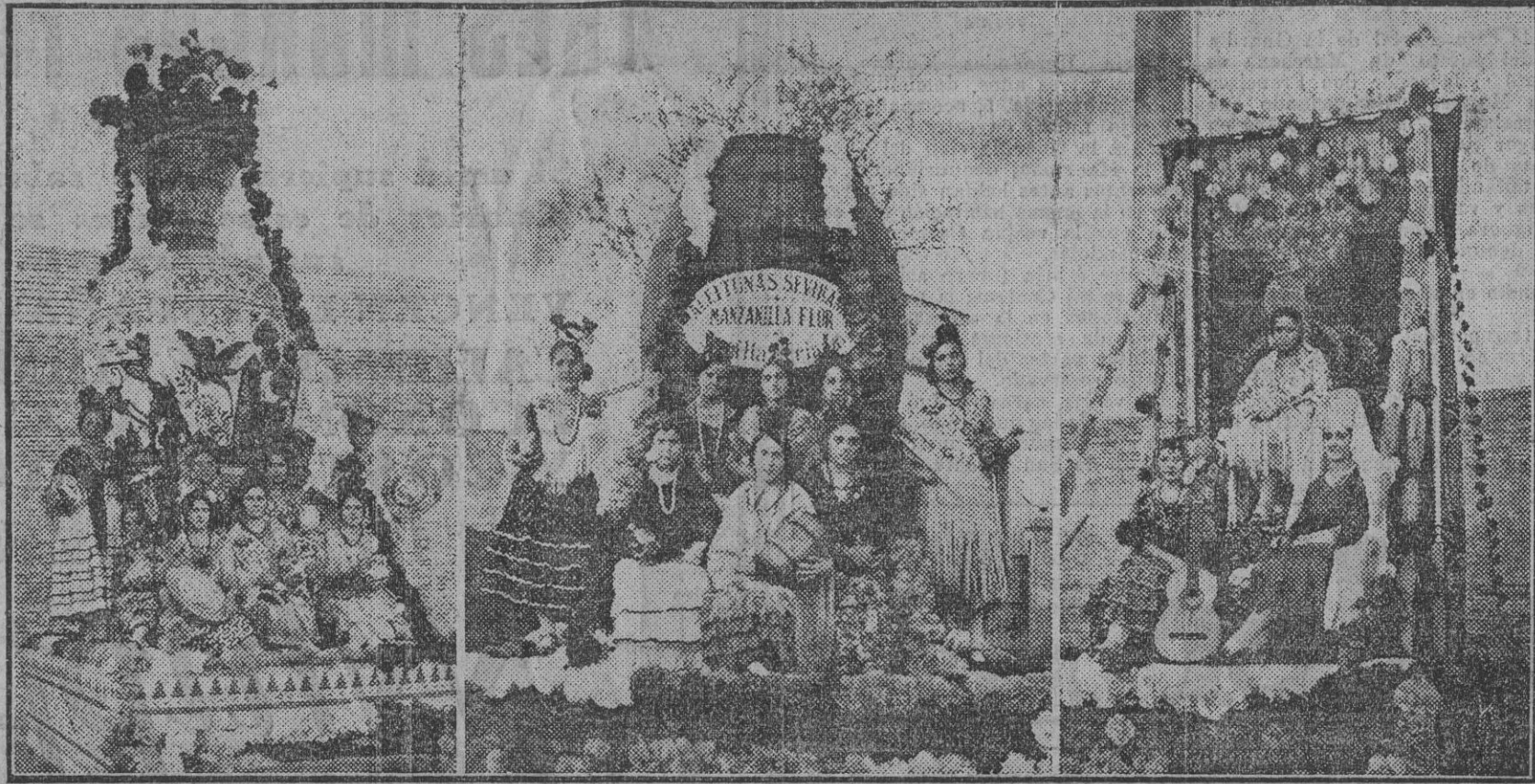
A la izquierda, la carroza de la industria de la cerámica. En el centro, la de la industria acolinera, y a la derecha, la carroza de Triana.