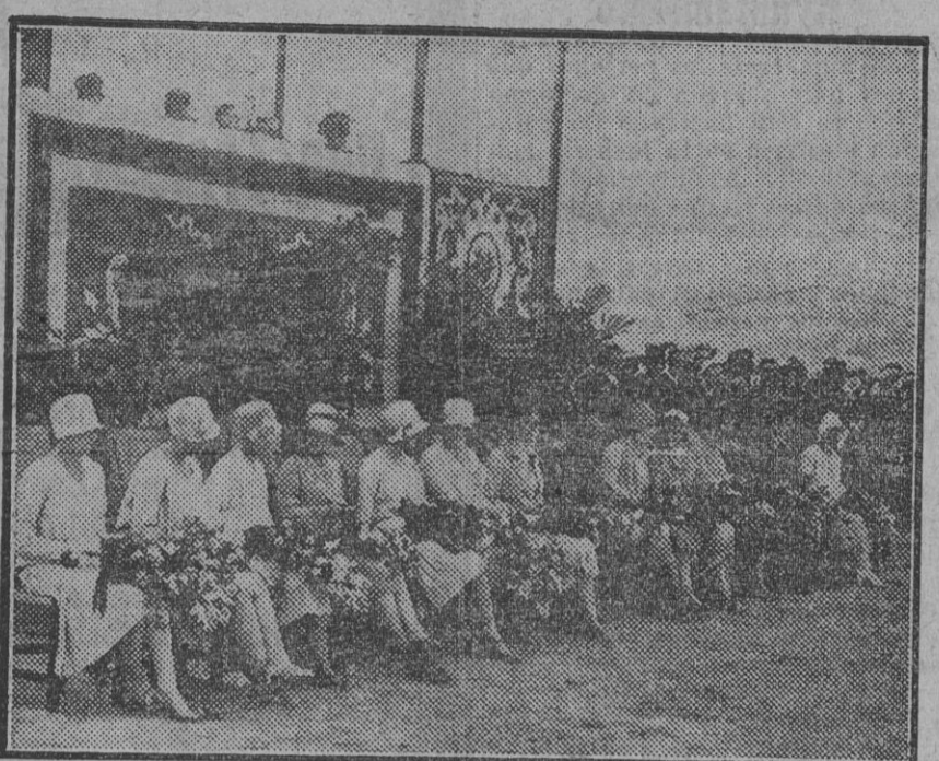
GETAFE.—Grupo de las infantas con las señoritas que fueron madres de las escuadrillas en la fiesta de la Aviación.