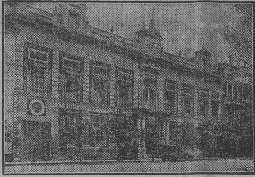
Casa-palacio en la Plaza del Triunfo adquirida por la Diputación Provincial para instalación de sus oficinas.

EL LIBERAL publica sus ediciones: De la noche, en las páginas 1, 2 y 3. De la mañana, en las páginas 4, 5 y 6.