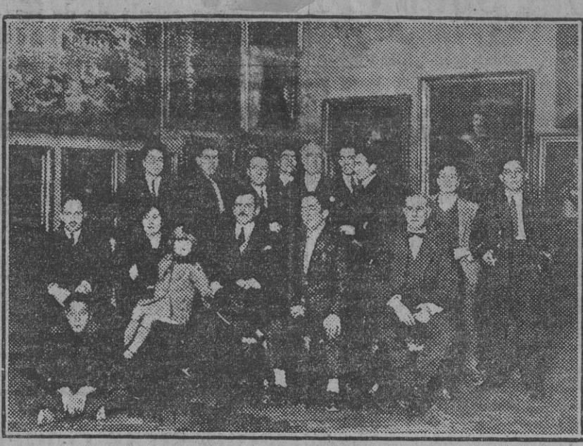
MADRID.—Alumnos, personal administrativo y de talleres de la Real Academia de San Fernando agraciados con dos vigésimos del 17.229, premiado con los quince millones. (Foto. Agencia Gráfica.) (Fdo. Gori.)

Sólo voy a permitirte un consejo: Al que habla con voz gangosa, muy cortada y arrastrando las erres, y ríe como un conejo... ¡despreciadlo! MATUSALEN.