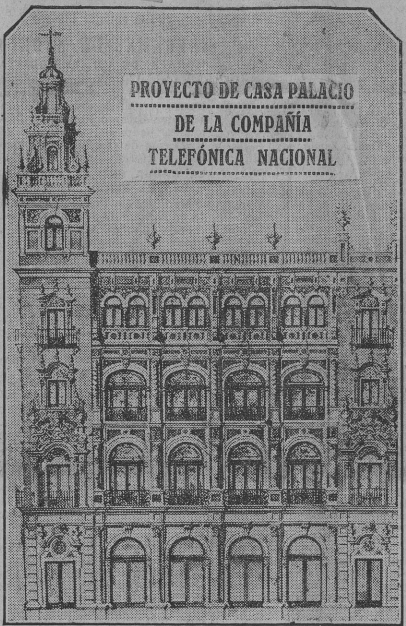
PROYECTO DE CASA PALACIO DE LA COMPAÑIA TELEFÓNICA NACIONAL

En 1923 el Ayuntamiento que presidió el señor conde de Halcón, lanzó un Empréstito para aguas. Por diez millones de pesetas y con su producto se han hecho obras para la toma y filtraje de aguas