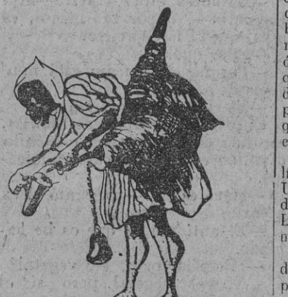
Así te veas vendiendo agua con una campanilla...

—No es un Viático eso que suena? —No, hombre. Son los aguadores.