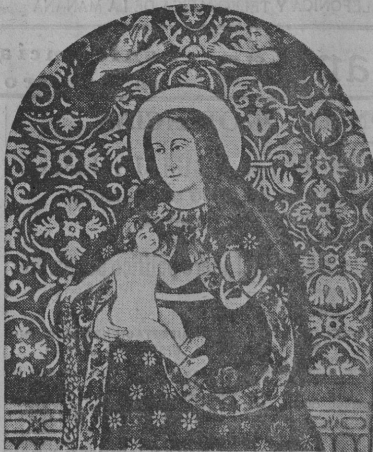
Nuestra Señora de la Cinta, Patrona de Huelva

Preparación de toda clase de inyectables. LABORATORIO. ESTERILIZACIONES General Primo de Rivera, 4.-Huelva