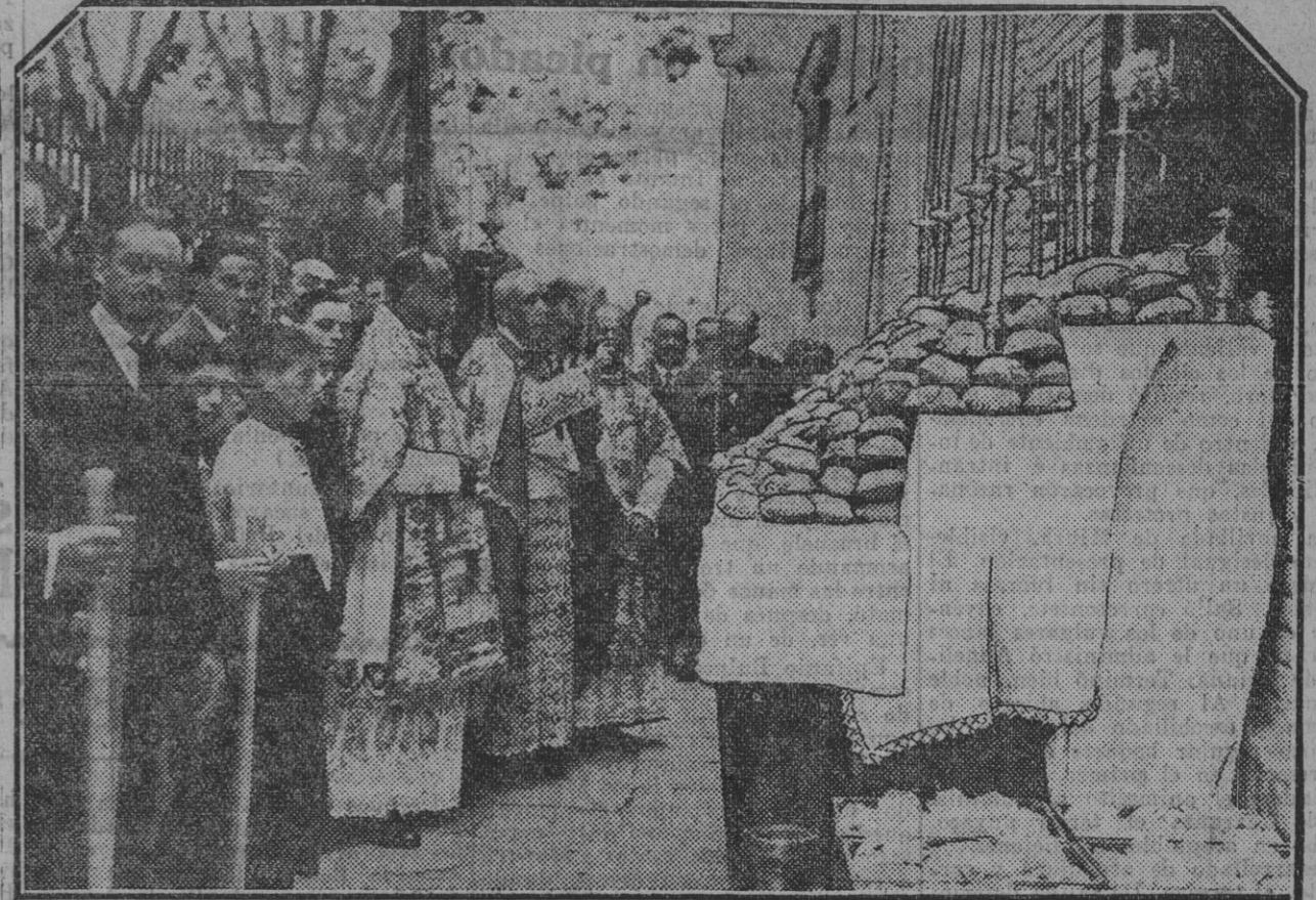
Bendición del pan que fue repartido entre los pobres por la Hermandad del Cristo de la Salud y la Virgen del Refugio (San Bernardo) con motivo de la función de la Cruz.