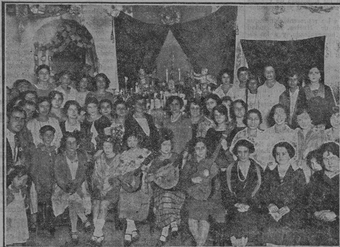
Grupo de concurrentes á la Cruz de Mayo instalada en calle San Vicente, 48.