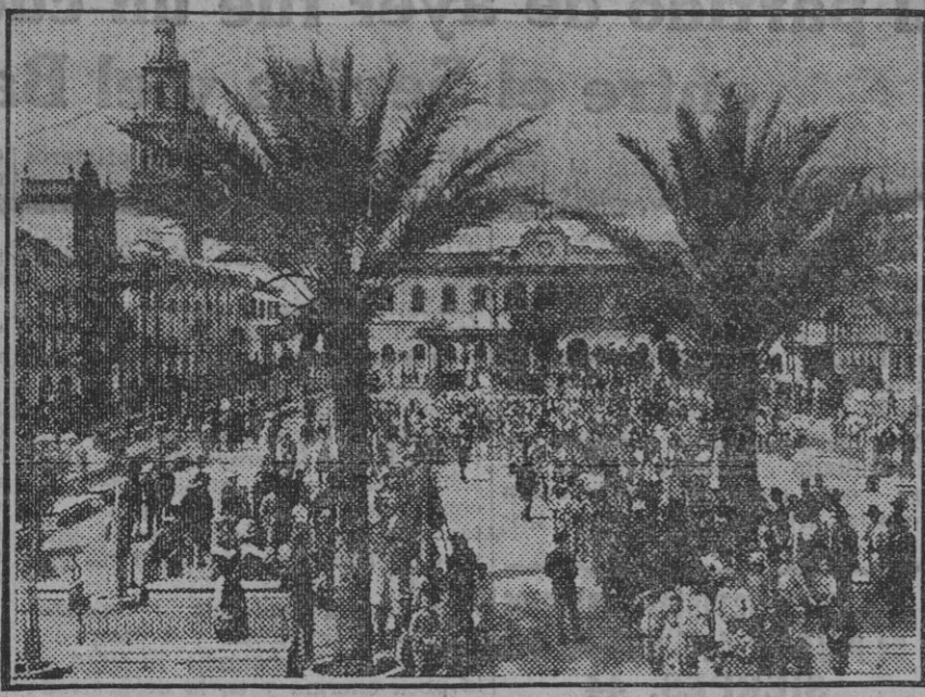
La fiesta del zagal del campo en Ecija

El próximo día 17 marcharán a Madrid y Barcelona el ingeniero y el director del Matadero municipal, con objeto de visitar los de reciente construcción en aquellas capitales y tomar antecedentes para las obras que en el nuestro se han de realizar en la dependencia del sacrificio de cerdos y en la nave de oro para el de esos vacunos.