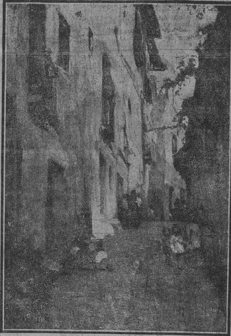
'Vieja celta toledana', uno de los magníficos cuadros expuestos en el Palacio de Arte Antiguo por el insigne y laureado pintor Gonzalo Bilbao.

695.000 dólares al presupuesto actual. El proyecto de ley está basado en unos efectivos de 12.000 oficiales y 127.000 hombres, mientras los efectivos actuales son de 11.000 oficiales y 118.000 hombres.