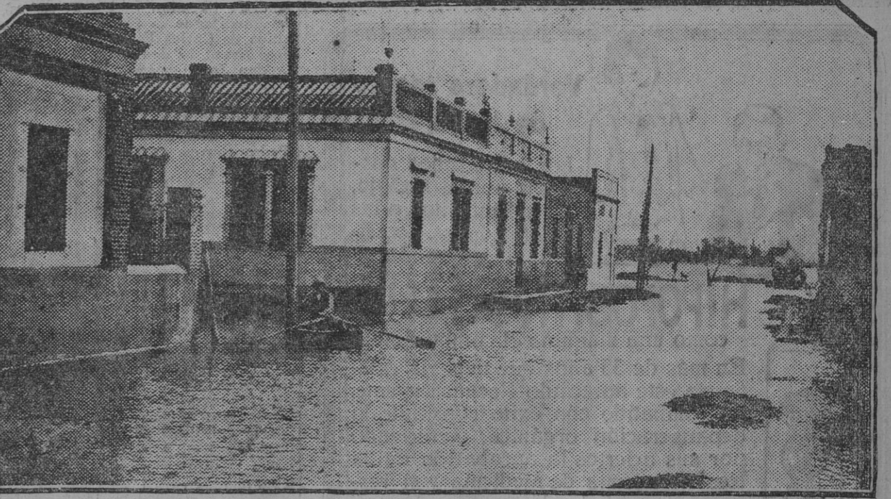
El barrio de la Torrecilla, inundado por las aguas del Guadalquivir. (Foto S. del P.) (Fdo. Gori.)

El río Guadaira viene hecho un mocito. Las aguas del Guadalquivir han entrado en el antiguo cauce, inundando los terrenos de los señores Camino, amenazando con llegar al paeo.