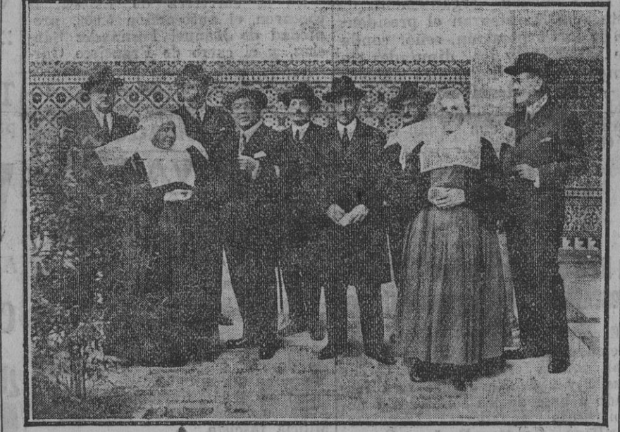
El Alcalde y el Presidente de la Diputación de Valencia en su visita, esta mañana, al Hospital Provincial. Fdo. Gori.

Resuelto lo del abandono, debe darse al protectorado un carácter que tienda principalmente a la explotación de la riqueza, con preferencia a las miras militares.