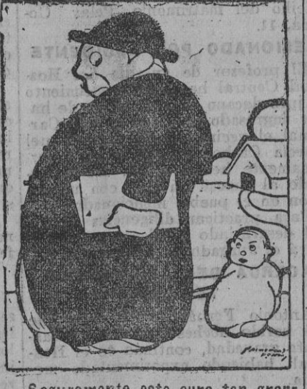
—Seguramente este cura tan grande es el que dice la misa mayor... (De Buen Humor, de Madrid.)

Este número ha sido visado por la censura gubernativa