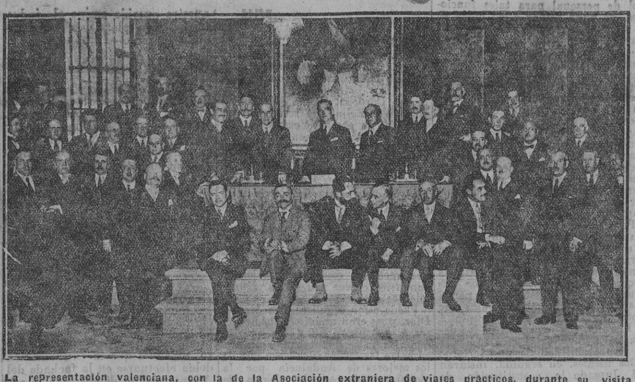
La representación valenciana, con la de la Asociación extranjera de viajes prácticos, durante su visita de ayer a nuestro Municipio, donde se celebró un acto en su honor. Fdo. Gori.