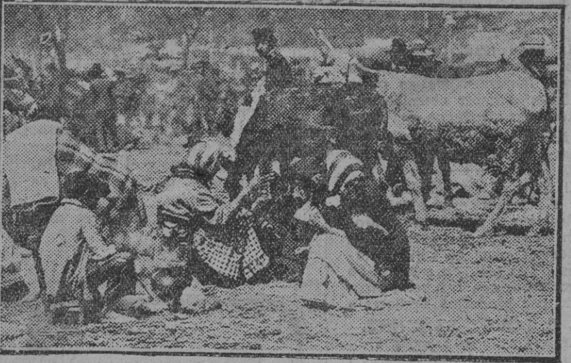
De nuestra Feria de Otoño.—Una vista del rodeo.

La aviación ha volado mucho y bien, y también ha dado su tributo con un aparato Fokker abatido, que se ha ido a pique, salvándose piloto y observador, que curan sus heridas en el «Barceló», buque hospital.