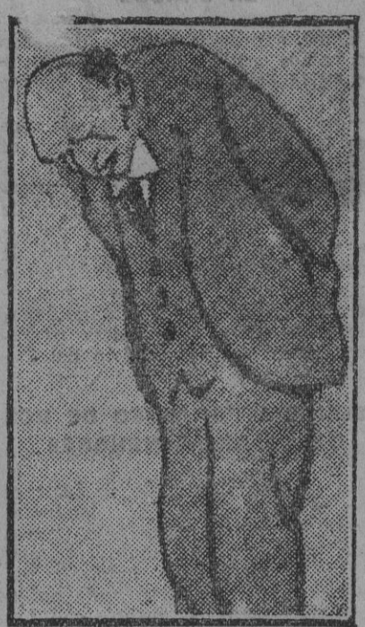
Lord Robert Cecil (visto por el dibujante Matt en «The Graphics»), quien ante los redactores enviados de todos los países ha dado amplias explicaciones para desvirtuar la creencia general de que la Sociedad de Naciones ha sufrido un rudo golpe por la obstrucción sistemática de Inglaterra.

Reciba la atribulada familia de la finada nuestro más sentido pésame.