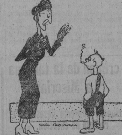
UN HIJO MODELO

—¿No te da vergüenza de fumar a tu edad? Si yo se lo dijese a tu mamá... —Pues no le diga usted nada, porque estoy aprendiendo para darle una sorpresa.