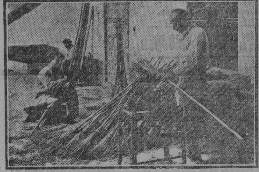
«Torbellino», fabricante al por mayor de escobones, y «El Cojo», hábil constructor de aventadores... con rabo.

—¿Todavía, abuela? —Por qué no. Yo no soy tan vieja... Hay otra infeliz a quien su familia privó de un pequeño capitán—trece mil reales—que tenía y la echaron a la calle a vivir de las