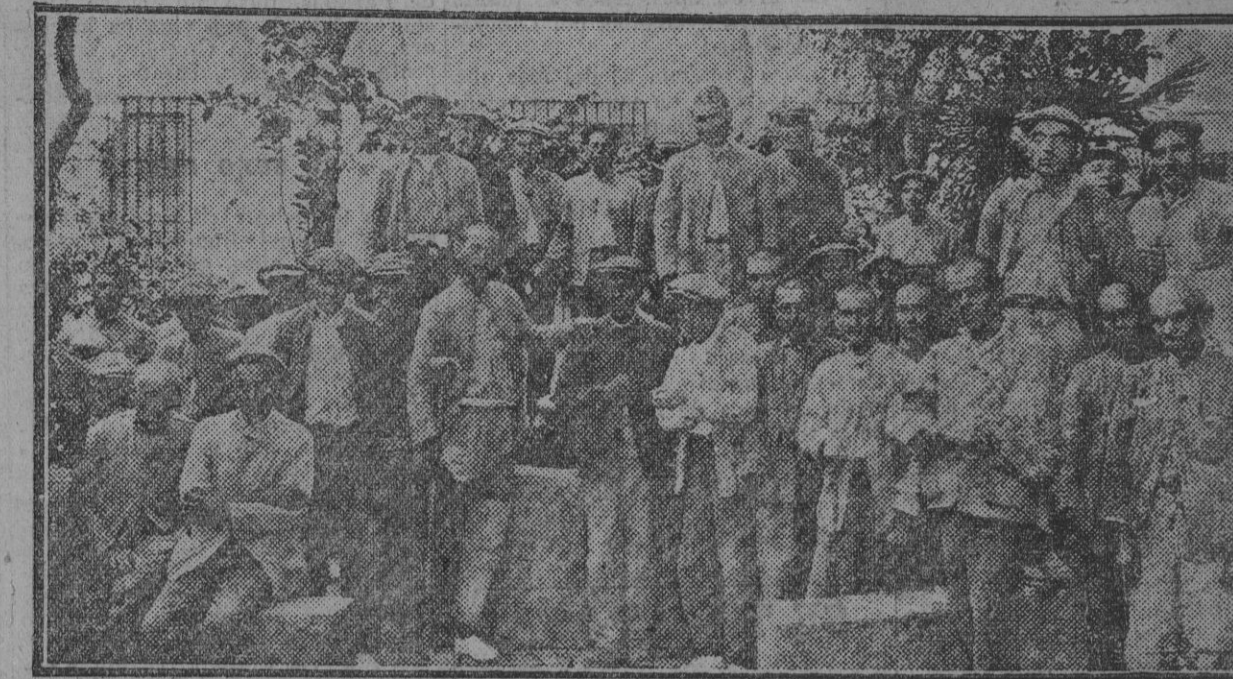
Grupo de mendigos recogidos en el Albergue de la calle de Santiago.

Pobres ricos.-Vagos y «mangones».-Torbellino, fabricante de escobas.-Las viejecitas y los niños.-Quiero irme para verle.-La «güenaventura».-La limosna fomenta el vicio.