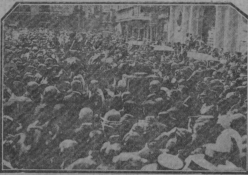
En el Salvador. Momento de colocar el féretro sobre el armon de artillería.

Al pasar el entierro por la calle Trajano observamos en un carruaje a una mujer enlutada, cubierto el rostro por un velo, que al pasar el cadáver se llevaba un pañolito a los ojos.