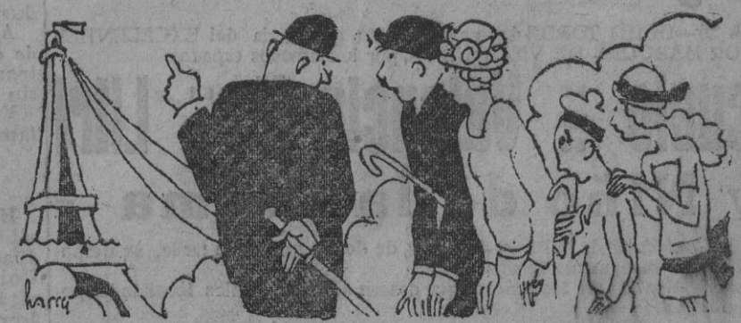
¿Veis esos alambres que parten de allí arriba? ¿los veis bien? Pues son maromas. Fdo. GORI.