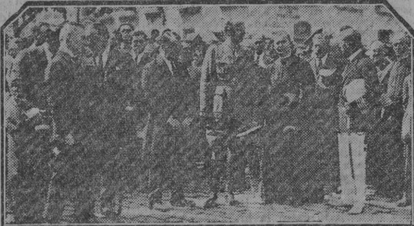
La presidencia del duelo. Fdo. Gori.

Seguridad, la parroquia, cantores y capilla.