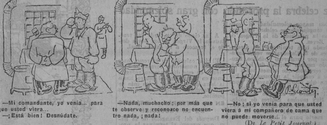
—Mi comandante, yo venía... para que usted viera... —Está bien! Desnúdate. —Nada, muchacho; por más que te observo y reconozco no encuentro nada, ¡nada! —No; si yo venía para que usted viera á mi compañero de cama que no puede moverse... (De La Petit Journal.)