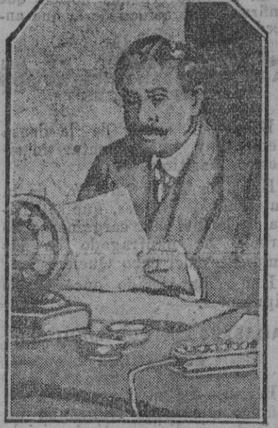
El Presidente del Consejo de Ministros de Francia, M. Painlevé, radiando su llamamiento á favor del Empréstito.