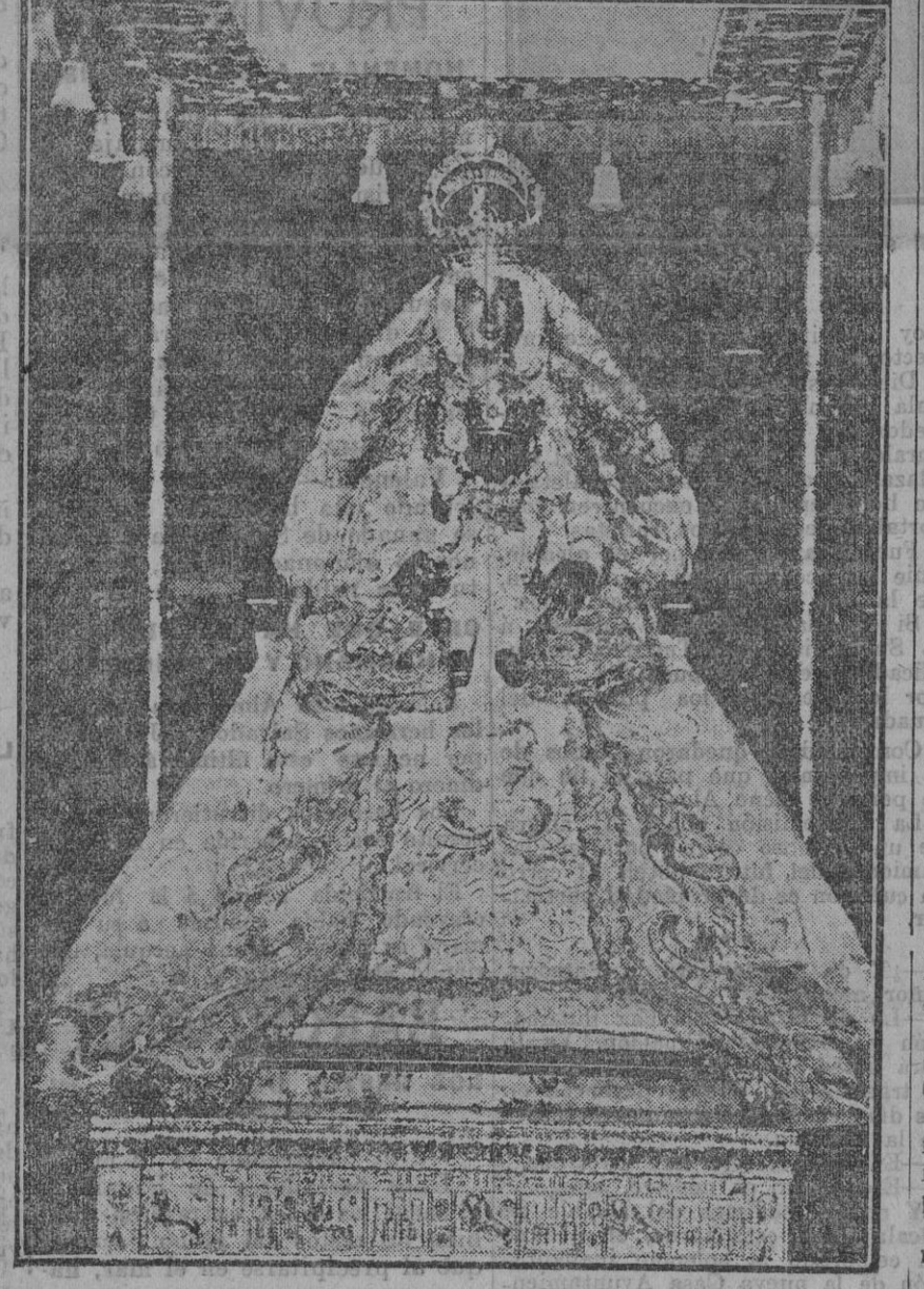
La venerada imagen de la Virgen de los Reyes, que procesionalmente salió esta mañana de la Catedral.

Yo no creo que el suicidio sea jamás un acto digno de alabanzas; mas lo perdono en aquellos casos en que con él se evita un mal mayor. Pero me indigna, me subleva que chiquillos y hombres, plenos de salud y de fuerza, se peguen un tiro porque perdieron un año en la carrera, porque se ven arruinados ó porque se les haya clavado en el corazón el puñal de una mala pasión ó un amor imposible. Yo tengo un amigo aristócrata, arruinado completamente por el juego, de cuyos labios oí estas sabias y saludables palabras: —Yo me río y desprecio á los hombres que se matan bajo el pretexto de que una contrariedad física ó moral truncó para siempre sus vidas. Cuando yo me vi sin otra fortuna que la muy menguada que representaban mi único traje y una pistola que guardaba no sé por qué, pensé, como tantos otros, que mi vida estaba inexorablemente rota. Mis amigos y hasta la mujer á quien yo quería me abandonaron, y como poster recurso, como supremo bien á que podía aspirar, pensé en la muerte. Contra mí sien derecha tuve apoyado el cañón del arma, y te juro que no temblé un instante; pero en el momento preciso me vi retratado en los cristales de una puerta y me encontré tan ridículo, tan ridícula y mentada cobardía, que desistí de mi suicidio. Vendí la pistola, compré un traje azul de obrero y me coliqué en las obras del Metropolitano. Mi vida no estaba rota, no; la rehice más humilde, menos fastuosa; pero la rehice... Hoy tengo callos en las manos; mas no importa, ¡vivo!