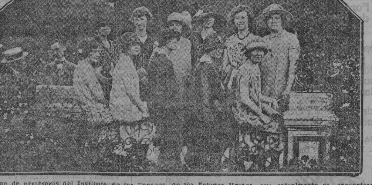
Grupo de profesoras del Instituto de las Españas, de los Estados Unidos, que actualmente se encuentran en Sevilla en viaje de estudios.