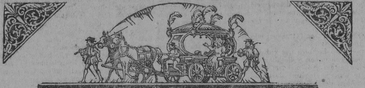
Evolución primitiva de la carroza de lujo

LA construcción de un automóvil es muy semejante a la de cualquiera otra máquina. Un buen automóvil debe no solamente ofrecer comodidad a los pasajeros sino que debe ser de construcción mecánica perfecta y funcionar con economía. Esto solo se verifica al cabo de años de servicio.