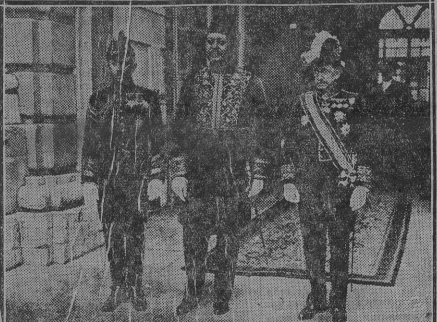
El ministro de Egipto al salir de Palacio, después de entregar sus cartas credenciales al Rey.