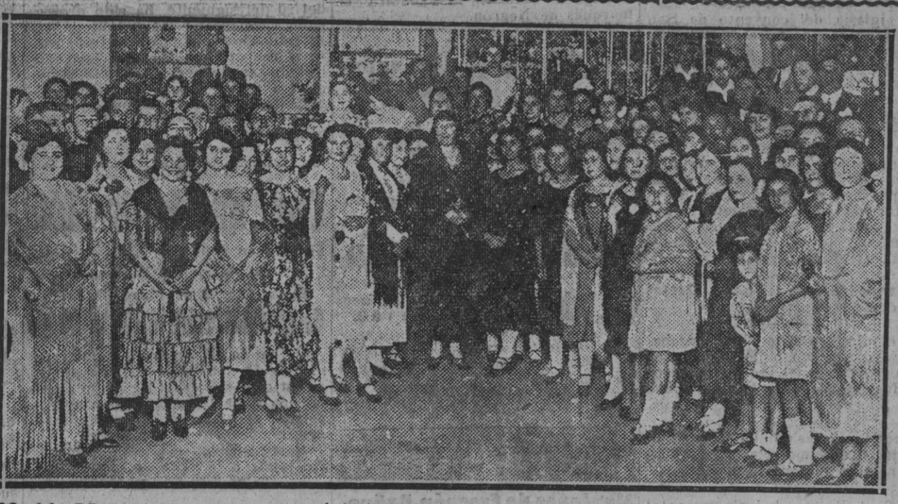
SS. AA. RR. las infantas Doña Luisa ó Isabel Alfonsa, acompañadas de las bellas jóvenes que asistieron a la buñolada en la «Cruz» de San Jacinto.