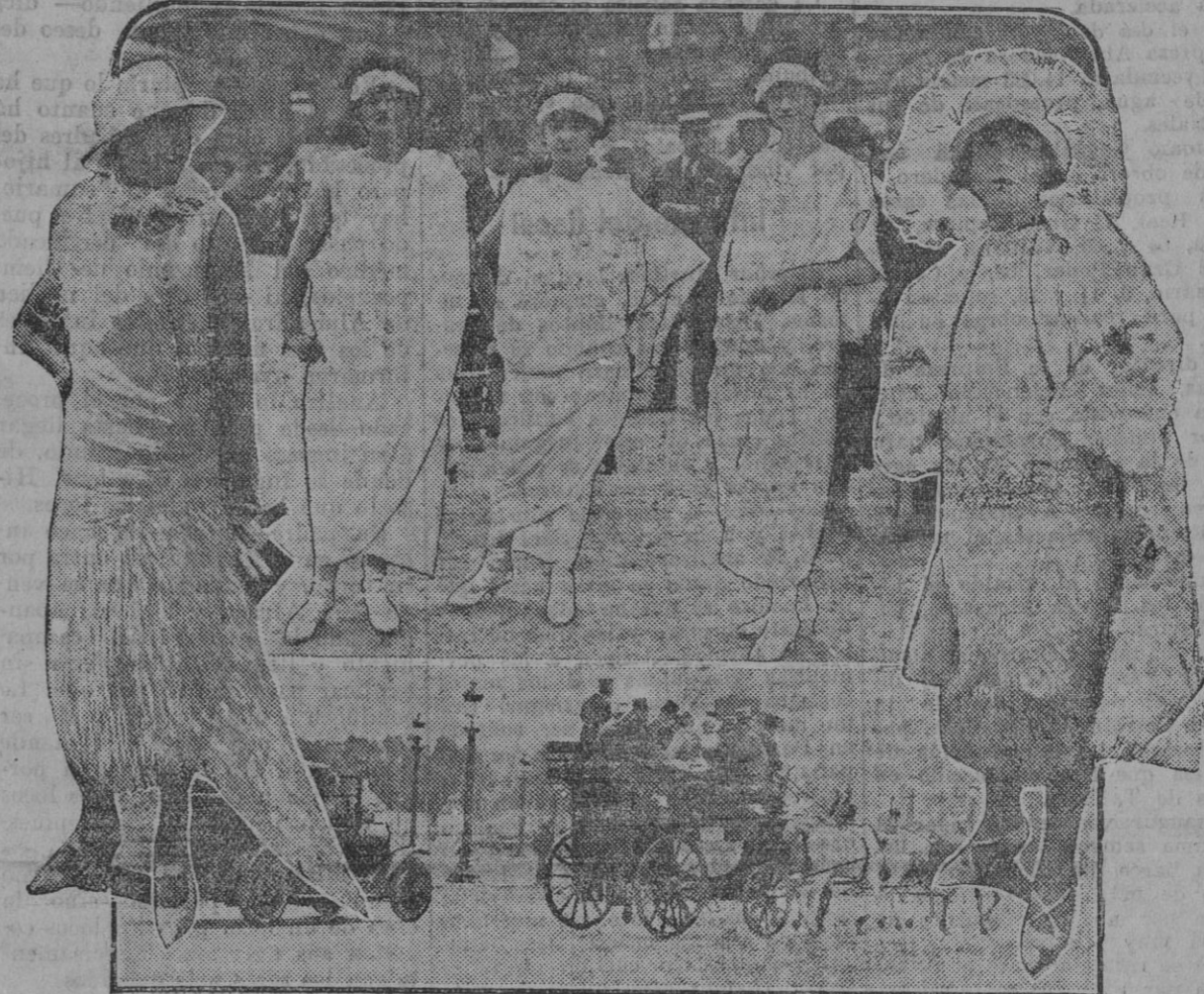
Durante la gran semana de las elegancias parisinas han surgido los tres modelos que aparecen en la parte superior de nuestro grabado recordando la sobria túnica griega, en contraste con las «toilettes» fantásticas creadas por los profesionales de la moda... Como se ve, todo es ventaja y Grecia en la comparación